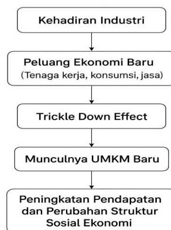
Gambar 2 1 Alur Konsep Penelitian

Kerangka pemikiran merupakan landasan konseptual yang menjelaskan alur logis dari hubungan antara variabel – variabel atau fenomena yang diteliti. Penelitian ini bertujuan untuk mengeksplorasi secara mendalam bagaimana kehadiran industri di Kecamatan Kabuh berdampak terhadap perkembangan UMKM lokal. Dengan demikian, alur penelitian ini dibangun atas dasar hubungan antara; Kehadiran Industri sebagai pemicu ekonomi wilayah, Trickle Down Effect sebagai mekanisme dampak tidak langsung, dan perkembangan UMKM Lokal sebagai bentuk nyata dampak terhadap ekonomi masyarakat. Dapat pula digambarkan seperti bagan di bawah ini :