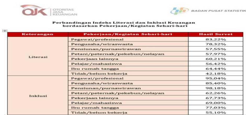
Gambar 1. 2 Perbandingan Indeks Literasi Dan Inklusi Keuangan Berdasarkan Pekerjaan atau Kegiatan Sehari-Hari

Adapun untuk indeks inklusi keuangan berdasarkan profesi, kelompok pensiunan/purnawirawan mencatat angka tertinggi sebesar 98,18 persen, disusul oleh pegawai/profesional (95,04 persen) dan pengusaha/wiraswasta (85,40 persen). Sebaliknya, kelompok yang tidak/belum bekerja, petani/peternak/pekebun/nelayan, serta pekerjaan lainnya menunjukkan tingkat inklusi keuangan paling rendah, masing-masing sebesar 55,10 persen, 62,26 persen, dan 67,73 persen.