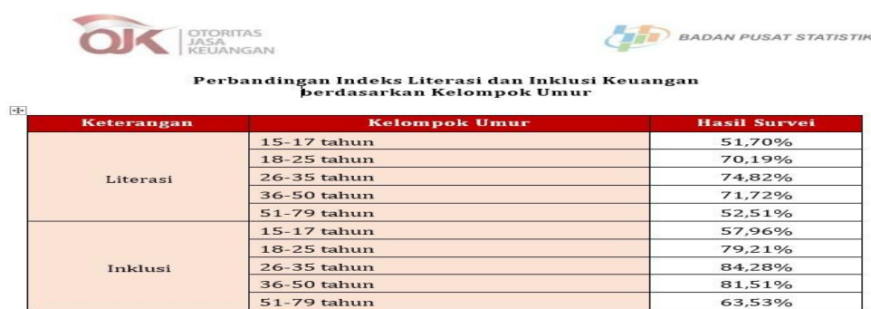
Gambar 1. 1 Perbandingan Indeks Literasi Dan Inklusi Keuangan Berdasarkan Umur

literasi dan inklusi keuangan masyarakat Indonesia sebagai dasar penyusunan program peningkatan di bidang tersebut. Untuk pertama kalinya, OJK menyelenggarakan SNLIK bersama Badan Pusat Statistik (BPS). Hasil survei tahun 2024 menunjukkan bahwa indeks literasi keuangan masyarakat Indonesia berada di angka 65,43 persen, sementara indeks inklusi keuangan mencapai 75,02 persen. Berdasarkan kelompok usia, indeks literasi keuangan tertinggi terdapat pada usia 26-35 tahun (74,82 persen), 36-50 tahun (71,72 persen), dan 18-25 tahun (70,19 persen). Sebaliknya, kelompok usia 15-17 tahun dan 51-79 tahun menunjukkan tingkat literasi keuangan terendah, masing-masing sebesar 51,70 persen dan 52,51 persen. Untuk indeks inklusi keuangan, kelompok usia 26-35 tahun mencatat angka tertinggi sebesar 84,28 persen, diikuti oleh kelompok usia 36-50 tahun (81,51 persen) dan 18-25 tahun (79,21 persen). Sebaliknya, kelompok usia 15-17 tahun dan 51-79 tahun memiliki indeks inklusi terendah, yaitu 57,96 persen dan 63,53 persen.