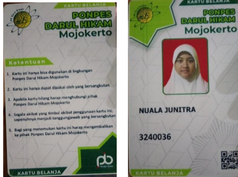
Gambar 1.1 Foto Tapcash Pondok Pesantren Darul Hikam Mojokerto

E-Money diterapkan untuk memberikan keuntungan kepada berbagai pihak, termasuk masyarakat, sektor industri, dan lembaga perbankan. Manfaat tersebut mencakup kemudahan dalam melakukan transaksi pembayaran dengan cepat tanpa perlu menggunakan uang tunai, baik untuk jumlah kecil maupun transaksi yang jumlah besar. Pembayaran dapat dilakukan dengan mudah dan cepat melalui pemanfaatan e-money. Tarisyah Alfadila, (2023) dalam Sumadi (2022).