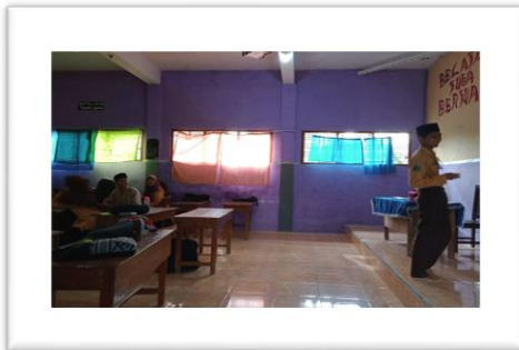
Proses melempar bola salju