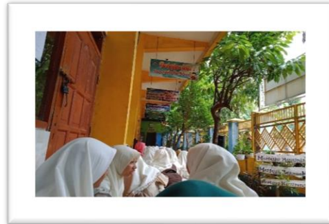
Pembacaan Istighosah, Tahlil Bersama