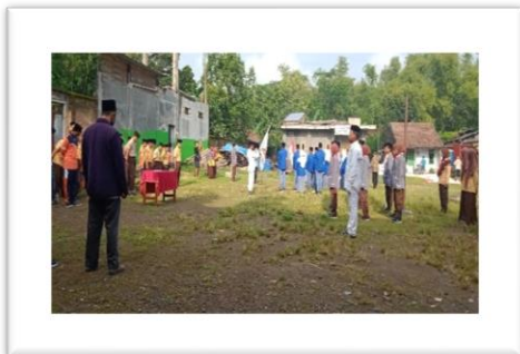
Pelantikan Ketua dan Anggota Osis