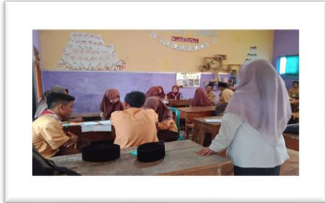
Proses kegiatan belajar mengajar