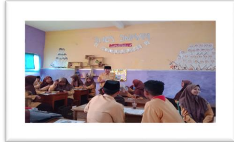
Berdiskusi secara kelompok